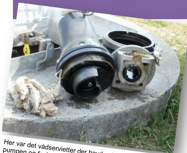
Her var det vådservietter der havde viklet sig ind i pumpen og forårsaget driftstop. Vådservietter er lavet af et fibermateriale som ikke opløses i vand.