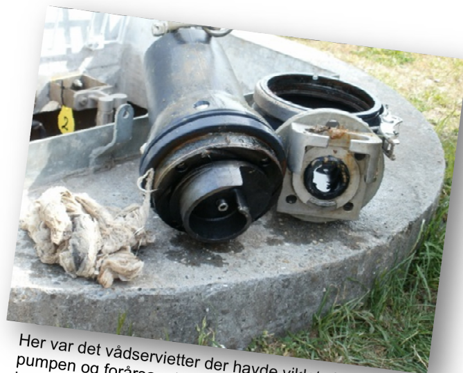
Her var det vådservietter der havde viklet sig ind i pumpen og forårsaget driftstop. Vådservietter er lavet af et fibermateriale som ikke opløses i vand.