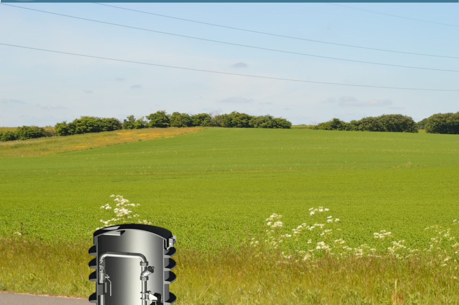
Øko Tran pumpestation fra Liqflow